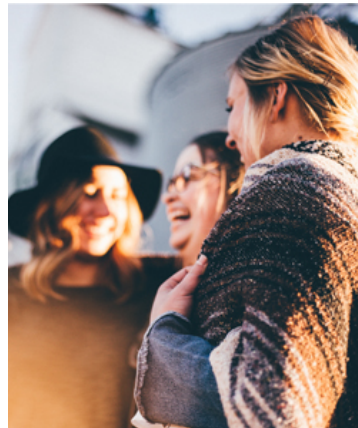
https://www.diphuelva.es/empleopublico/contenidos/PROYECTO-INTREPIDA-Un-a-Gestor-a-de-Proyectos-Europeos/ Proyecto Intrépida