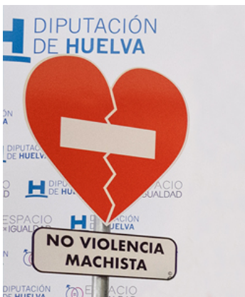
/export/sites/dph/igualdad/galleries/documentos/Campana-Senal-NO-Violencia-Machista-hasta-6-marzo-2020.ppt.pdf Stop violencia machista