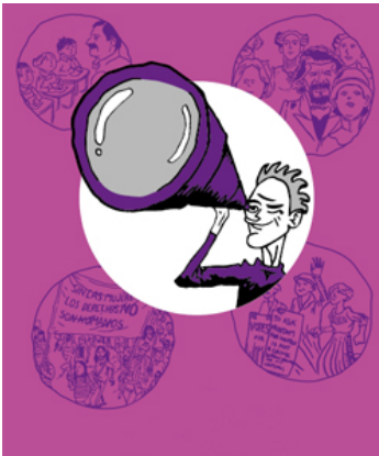
https://www.diphuelva.es/igualdad/contenidos/HOMBRES-QUE-SUENAN-CON-IGUALDAD/ Hombres que sueñan con igualdad