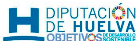
LOGOTIPO DIPUTACIÓN DE HUELVA

En todas las operaciones cofinanciadas por el Fondo FEDER que se lleven a cabo como parte integrante de la Estrategia DUSI de la Diputación de Huelva, se deberá reconocer el apoyo del Fondo Europeo de Desarrollo Regional, con su lema correspondiente “Una manera de hacer Europa”, además de los emblemas institucionales de la Unión Europea, incluida una referencia expresa a la misma, y de la Diputación de Huelva. Todos ellos deben convivir, de una manera uniforme y estandarizada. Esto implica que deben mostrarse los siguientes elementos: